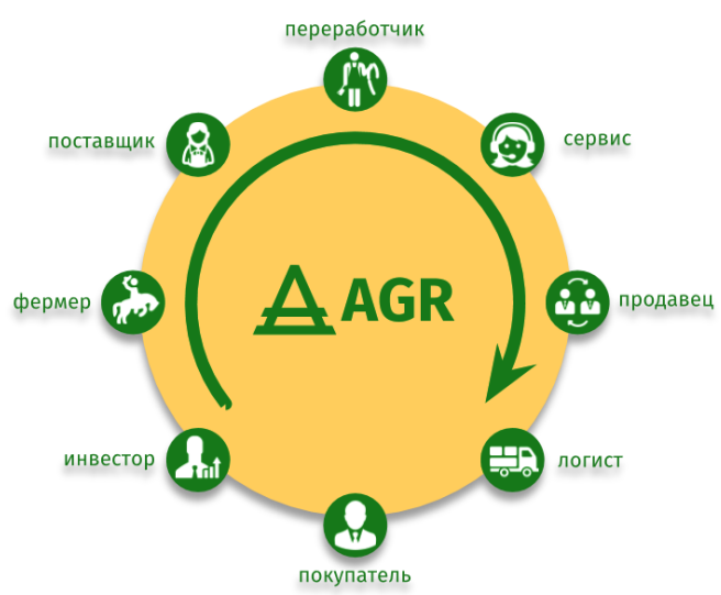
ОБЪЕДИНЕНИЕ УЧАСТНИКОВ ЭКОСИСТЕМЫ AGRARIUM